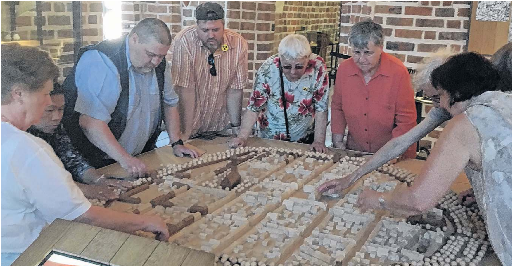
Das Stadtmodell kann ertastet werden.