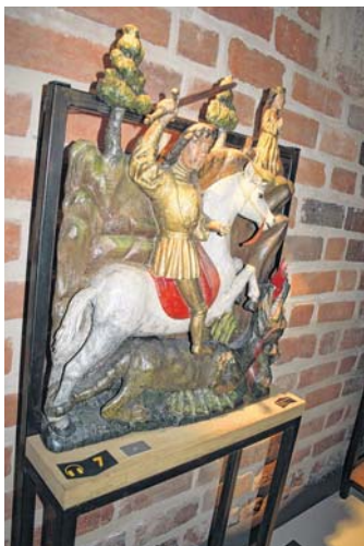
Die Nummern für den Audio-Guide sind erhaben gestaltet und auch in Braille-Schrift hinterlegt. Auf dem hinteren Schildchen steht „Bitte nicht berühren“.

Kontakt zur Autorin s.schulz@nordkurier.de